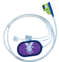
Cavo elettrodi training CPR Uni-padz Codice 8028-000010

ZOLL Medical Corporation Worldwide Headquarters 269 Mill Road Chelmsford, MA 01824 978-421-9655 800-804-4356