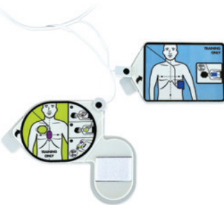
Gel adesivi sostitutivi per elettrodi Trainer CPR Uni-padz® Codice 8028-000012 (Conf. 5 pz.)

Le parti di ricambio devono essere ordinate separatamente.