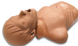
Manichino dimostrativo Trainer Codice 8000-0835-01