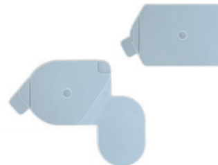
Rivestimenti sostitutivi per elettrodi Trainer CPR Uni-padz Codice 8028-000013