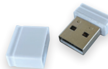
Kit di aggiornamento software USB Trainer Codice 8028-000011-XX